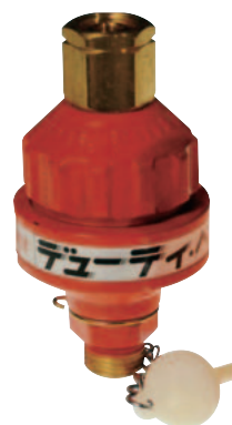
デューティーペア (乾式安全器)(DP-06H)