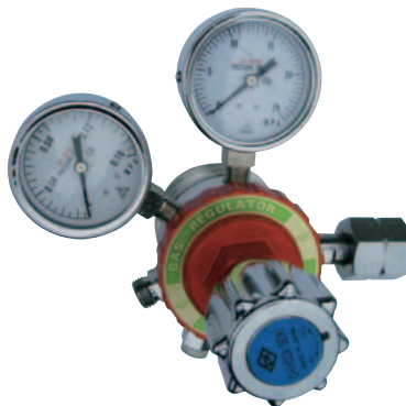
フィン付き調整器

天然ガス、エチレン共に減圧すると温度低下し弁が作動しなくなりますので、減圧調整器はフィン付き調整器をお使いください。逆火防止器は弊社デューティーペア(乾式安全器)をお使い下さい。